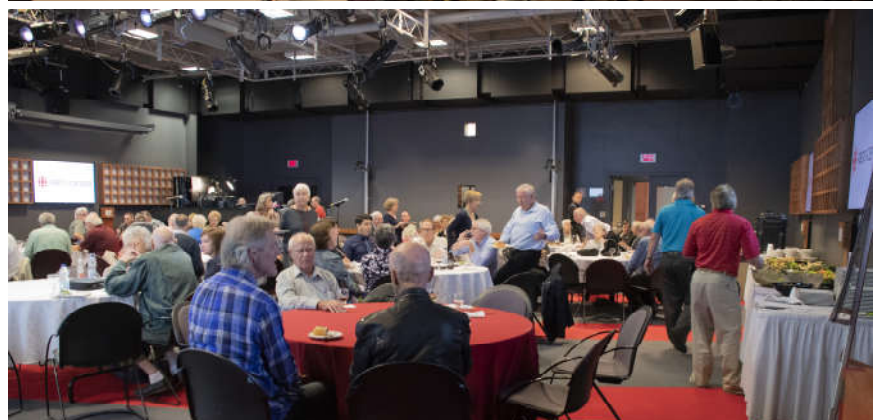
C'EST L'HEURE D'UN LÉGER GOÛTER