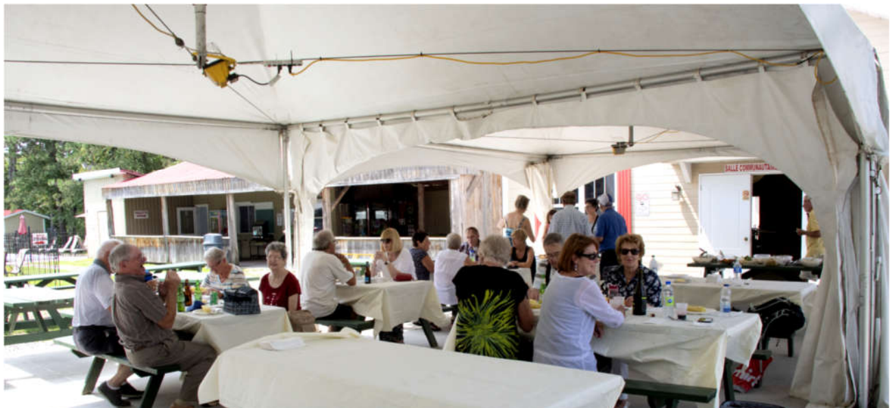
Plus d'une vingtaine de retraité(e)s et conjoint(e)s ont participé(e)s au pique-nique annuel organisé par le Comité des activités sociale de l'AQR au Camping Domaine Tournesol à Cowansville le 8 août dernier.